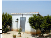
Pumpenhaus + Werkzeuge