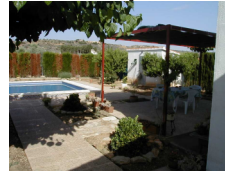
24 m2 Terasse mit Naturschatten