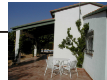
18 m2 Überdachte Terasse